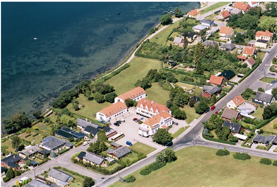
Skansevej 22 Hovedbygning