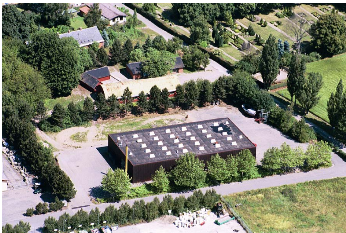
Klostergården Blå linie's værksteder