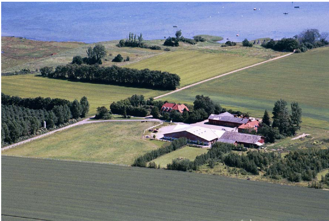
Plantagevej 16 b Grøn linie's værksteder